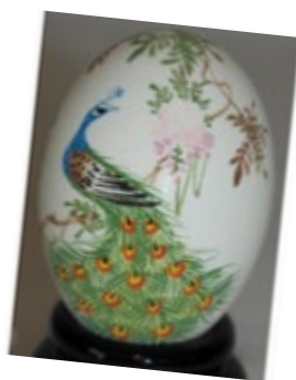
œuf de Chine

Laisser libre à son imagination pour peindre son œuf.