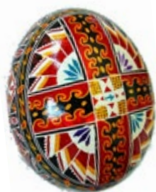
œuf d'Europe de l'Est