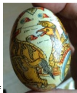
œufs de Chine